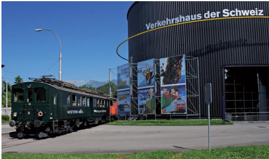
Einmaliges Erlebnis: Einfahrt ins Verkehrshaus mit dem Apfelsaft-Express

Der legendäre Triebwagen Be3/4 entführt Sie als Extrazug auf eine originelle und abwechslungsreiche Reise über interessante Strecken nach Luzern. Schauen Sie während der Fahrt dem Lokführer über die Schulter und geniessen Sie «Ihren Zug». Entdecken Sie die faszinierende Geschichte des Verkehrs und der Mobilität im Verkehrshaus in Luzern bei einem Blick hinter die Kulissen. Zudem steht Ihnen auch das Filmtheater zur Verfügung. Auf der Rückfahrt servieren wir Ihnen einen währschaften Imbiss inklusive Dessert, der den erlebnisreichen Tag ausklingen lässt. Ein exklusiver Ausflug, den es nicht zu verpassen gilt!